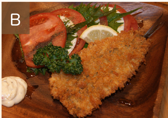
B イワシフライとトマトの挟みチーズ添え

コーンを混ぜ合わせトマトケチャップで味付けした ライスの上にジューシーに焼き上げた鶏肉を乗せています。