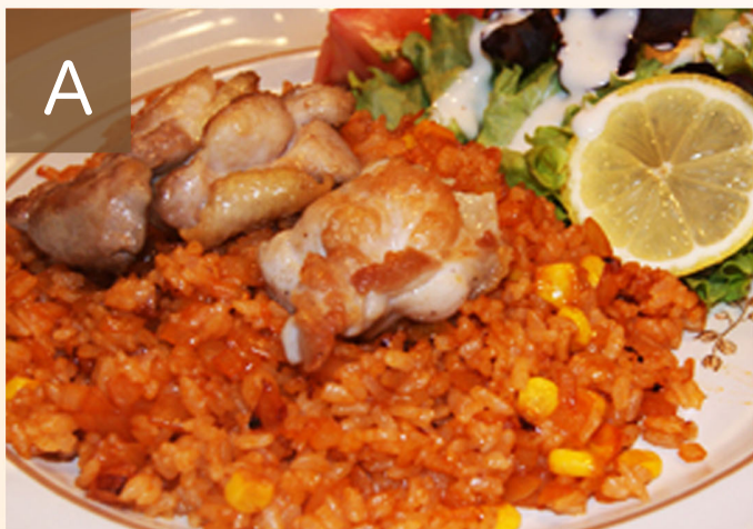
A 鶏肉のせちキンライス

コーンを混ぜ合わせトマトケチャップで味付けした ライスの上にジューシーに焼き上げた鶏肉を乗せています。