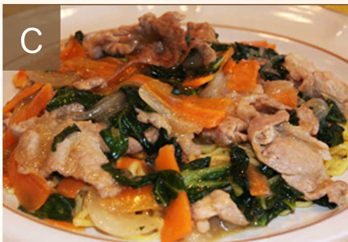
C あんかけ焼きそば

揚げたてのイワシフライに大葉とチーズをサンドした冷やしトマトを添え、 オリーブオイルをソースとして味付けしております。