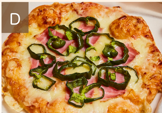
D 手作りピザ (ミックスピザ or ベーコン&エッグピザ)

種類の中で大人気のメニュー。 特に女性のお客さまからのご注文が多いオススメ絶品メニューです。